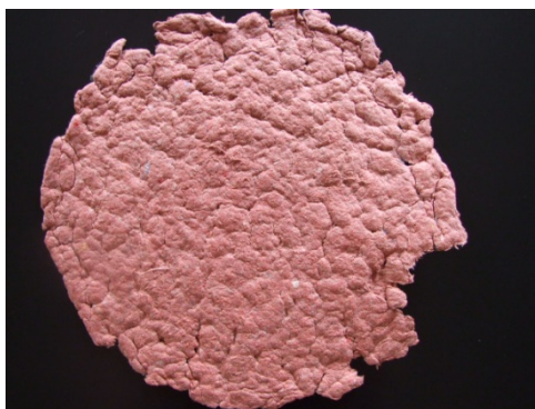
Slika 3. Reciklirani papir dobijen na času

Inegativni pristup nastavi je veoma važan za decu sa smetnjama u razvoju zbog: